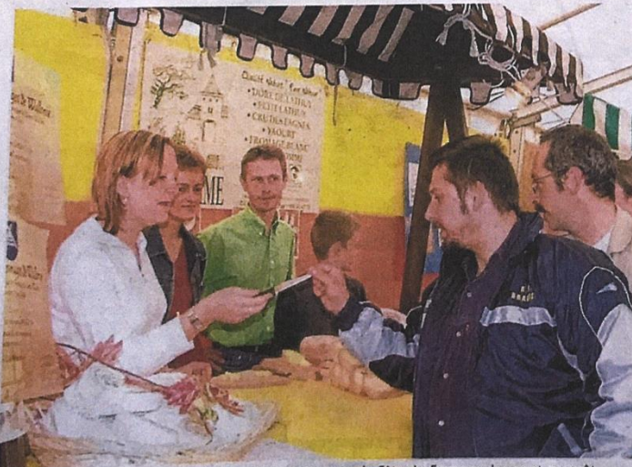
Le château de Harzé attend près de 10 000 personnes pour la Fête du Fromage, les 19 et 20 août.