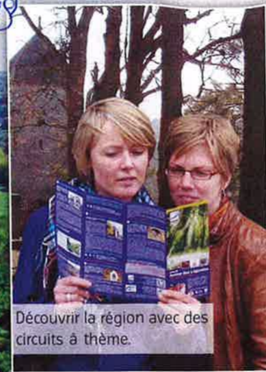
Découvrir la région avec des circuits à thème.