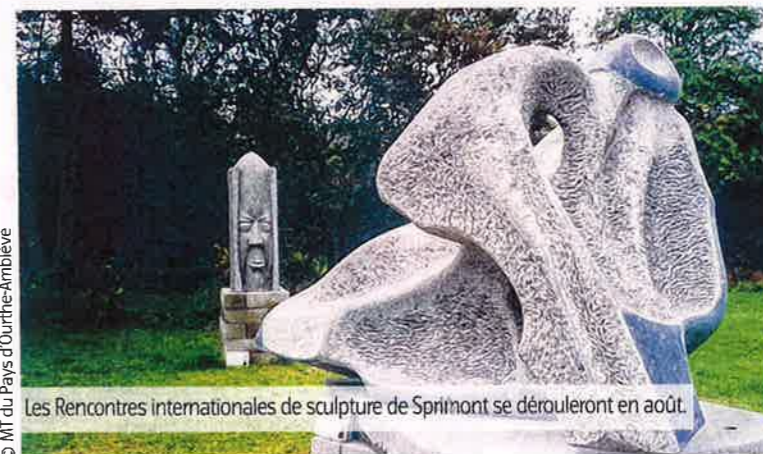
Les Rencontres internationales de sculpture de Sprimont se dérouleront en août.

Le dimanche 25 août, pour les festivités de clôture de l'événement, un autobus historique conduira les visiteurs à Damré où un train à voie étroite prendra la relève. Une collec-