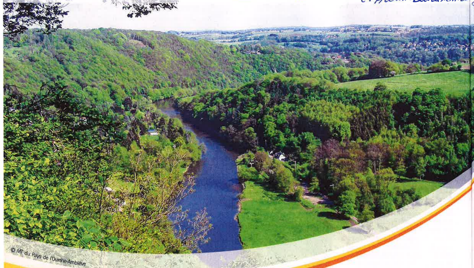
La vallée a été creusée par de nombreuses rivières. Des promenades permettent de découvrir ce paysage.